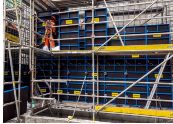
Kolay taşınabilirliği sayesinde hızlı panel kalıp uygulaması