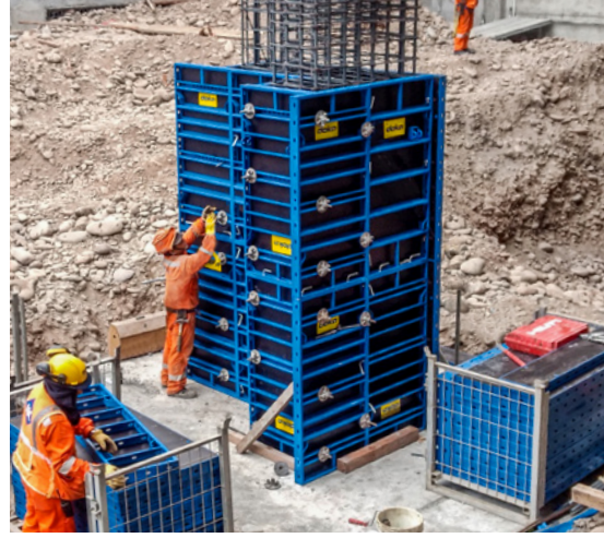
Zorlu geometrik yapıdaki kolonlar bile kolayca şekillendirilebilir