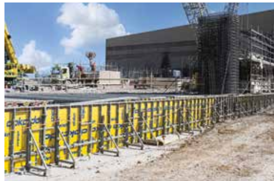
Erillisiä jäykistyksiä ei tarvita myöskään pitkissä linjauksissa.