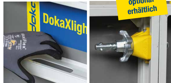
Einfaches Handling durch integrierte Griffe und leises, zeitsparendes Schalen dank DokaXlight Elementverbinder I