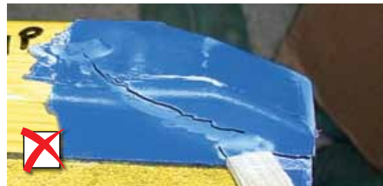
Beschadiging van de plastic kap

In de langsrichting van de flens, met een breedte van meer dan 2 mm zijn niet toegestaan.