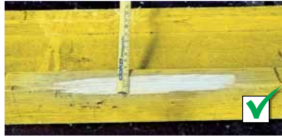
Schuin op een hoek afgebroken stukken

Tot max. een diepte van 10 mm en een lengte van 500 mm.