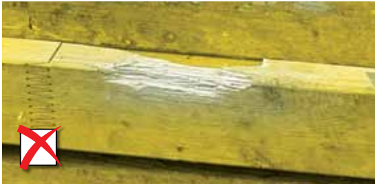
Aan de zijkant afgebroken stukken

Tot max. een diepte van 10 mm en een lengte van 500 mm.