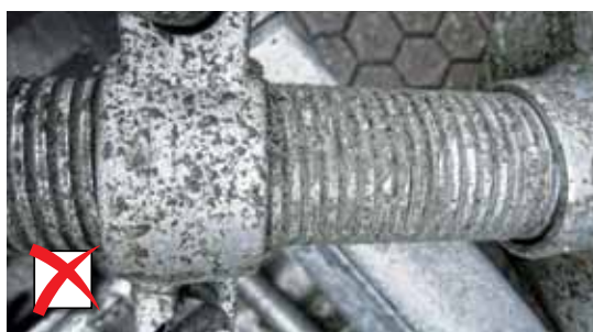
Gereinigde toestand van toebehoren

Schroefdraden moeten vrij zijn van beton.