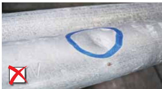
Deuken en kabelinsnijdingen

Moeten intact zijn en perfect functioneren.