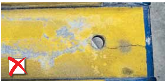
Barsten aan de basis

De plastic beschermkap moet intact zijn.