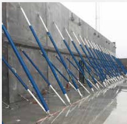
Aan betonnen prefab elementen

Nauwkeurig gebruik van DokaRex aan alle soorten prefab elementen.