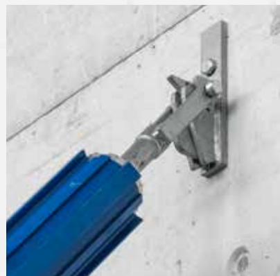
Aansluiting vanaf de grond door middel van de snelaansluitkop