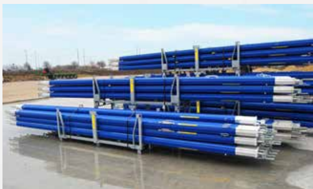
DokaRex wordt volledig gebruiksklaar op de bouwplaats afgeleverd.