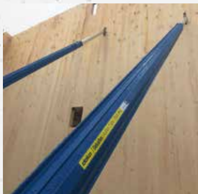
Aan hout- en staalconstructies