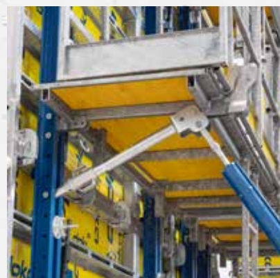
Stelschoren aan Xsafe plus vloer (met aansluitset voor schoorkop)