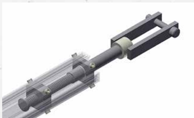
De verborgen schroefdraad beschermt tegen verontreiniging, heeft een lange levensduur en vereist weinig onderhoud.