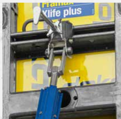
Stelschoor aan bekisting (met aansluitset voor schoorkop)

De DokaRex stelschoren kunnen met behulp van een eenvoudige aansluitset ook aan alle Framax, Frami en Top 50 wandbekistingen worden gebruikt.