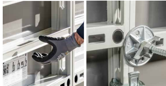
Leichtes Handling durch integrierte Griffe und hohe Einsatzzahlen dank langlebiger Xlife-Platte und Ankerlochschutz