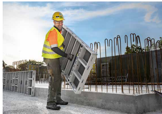
Immer wenn es ohne Kran schnell und leicht gehen muss, ist die DokaXlight die ideale Schalung