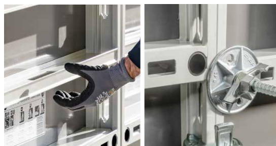
Utilisation simple avec les poignées intégrées, et grand nombre de réemplois grâce au panneau Xlife et à la bague de protection pour ancrage.