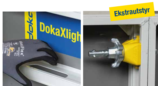
Enkel håndtering med integrerte håndtak og stille, tidsbesparende forskaling med DokaXlight I-kobling