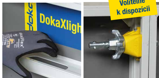
Jednoduchá manipulácia vďaka integrovaným rukovätiam a tiché, časovo úsporné debnenie vďaka DokaXlight panelovým spojкам I