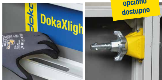
Jednostavno rukovanje zahvaljujući integrisanim ručkama i brza montaža uz nizak nivo buke zahvaljujući DokaXlight I-Connectoru