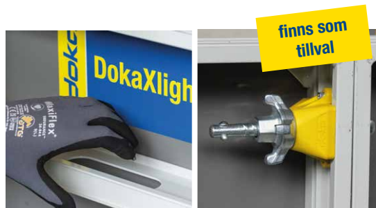
Enkel hantering genom integrerade handtag och tyst, tidsbesparande formning tack vare DokaXlight I-Connector