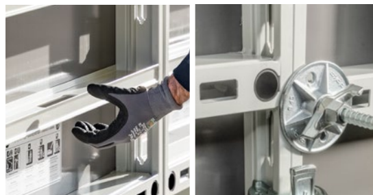
Leichtes Handling durch integrierte Griffe und hohe Einsatzzahlen dank langlebiger Xlife-Platte und Ankerlochschutz