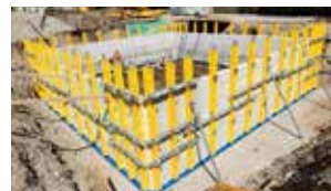
Wimberger Bau GmbH