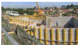
Hazet Bauunternehmung GmbH