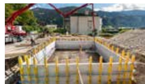
Zimmermann & Co. GmbH

* bei Verarbeitung und Anwendung gemäß DokaBase Anwenderinformation und anwendbaren Normen.