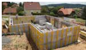
Konstruktiva Bau GmbH