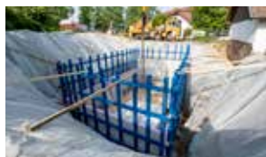
F Lang u K Menhofer BaugesmbH