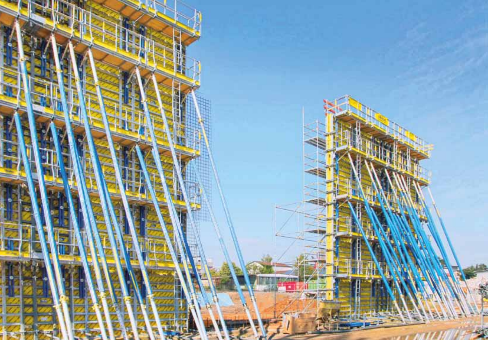
▲ Justierstützen Eurex 60 dienen zum sicheren Abstützen und Einrichten der hohen Wandschalungen Framax Xlife plus.