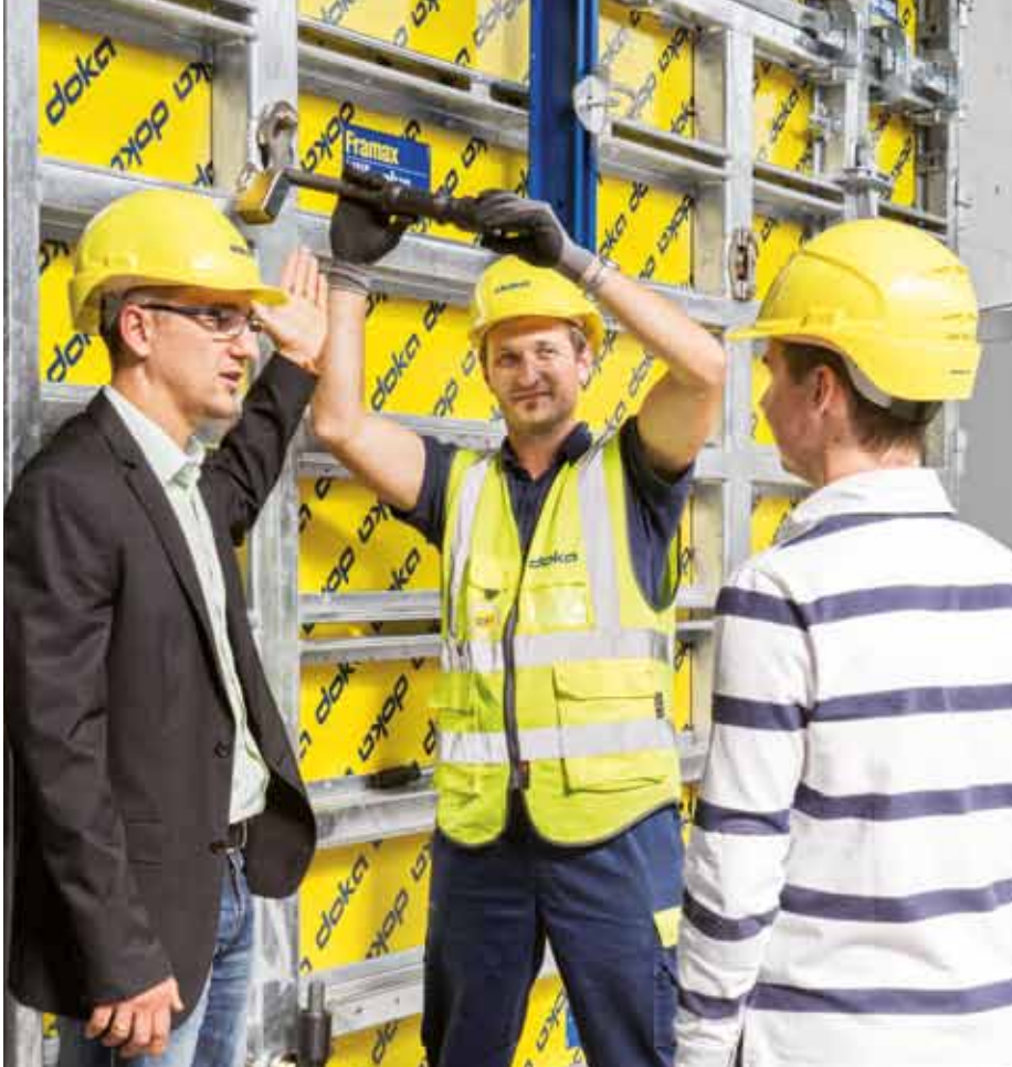
▲ Von Praktikern für Praktiker: Doka vermittelt konkretes Praxiswissen für Ihre Baustellen.