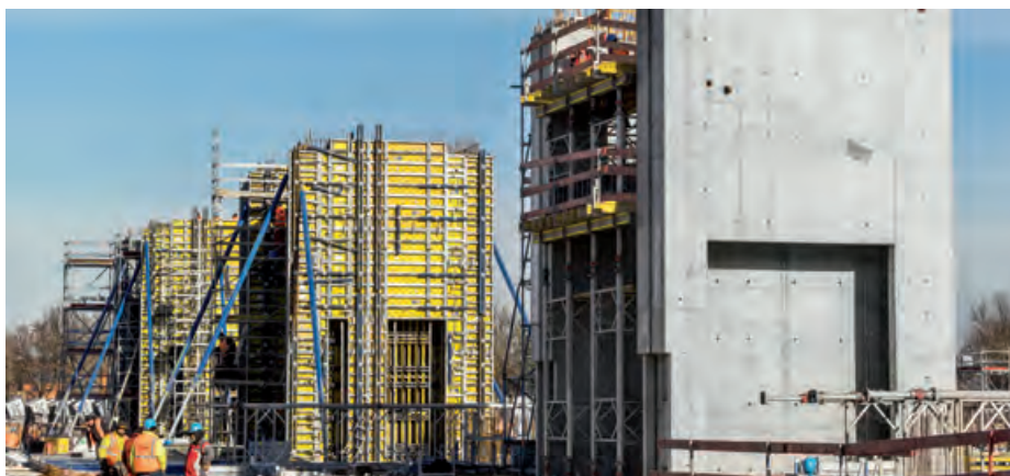
◀ Messe München – Portal aus einem Guss.

Lösung: 79 schnell zusammen- und umsetzbare Schalkästen