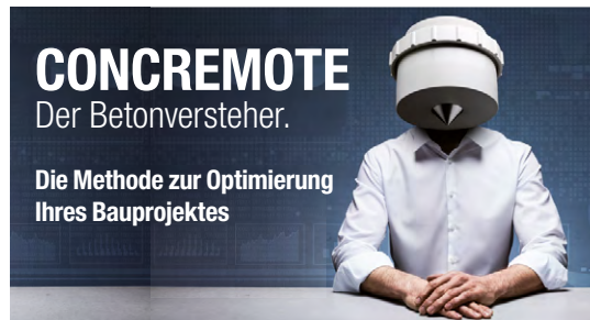
Concremote von Doka