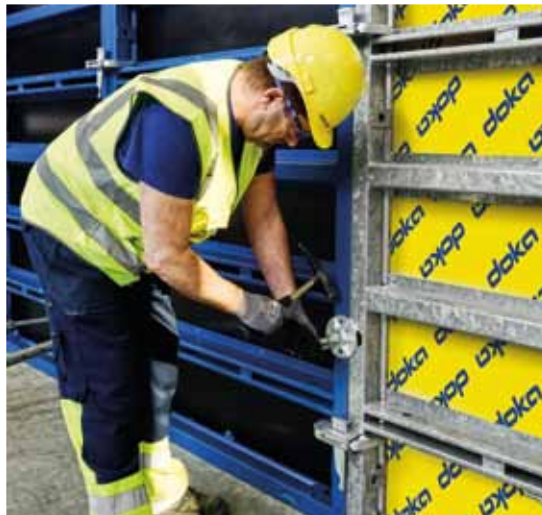
System Framax eco jest w pełni kompatybilny z systemem Framax Xlife dzięki zintegrowanemu systemowi ryglowania, rozmieszczeniu otworów ściągów oraz kształtowi ram.