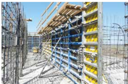
Doskonale zaprojektowane i niezawodne komponenty systemu ułatwiają bezpieczną pracę na placu budowy.