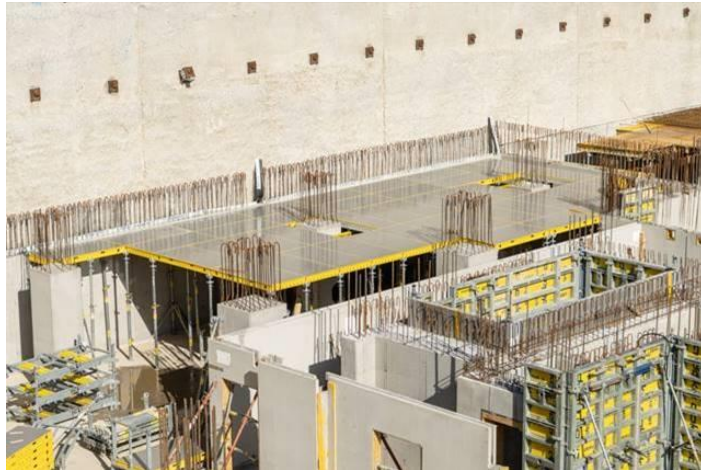
DokaXdek-Element bei ARGE Quadrill, Linz – Österreich