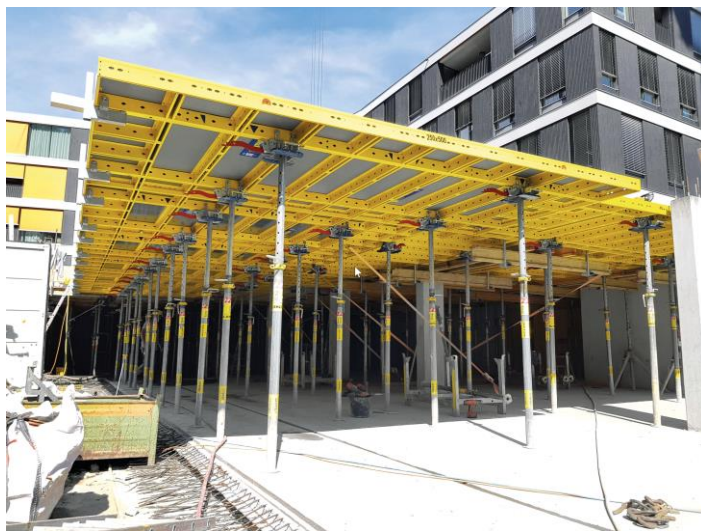
DokaXdek-Tisch bei ARGE Garnmarkt, Götzis – Österreich