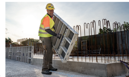
DokaXlight è la soluzione ideale ogni volta che i lavori devono procedere velocemente e in modo semplice senza l'impiego della gru