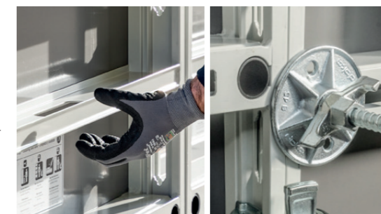
Maneggevolezza semplice, grazie alle maniglie integrate. Elevata frequenza d'uso, grazie alla lunga durata del pannello e della protezione speciale per fori di ancoraggio