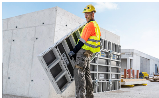
DokaXlight est la solution idéale sur les chantiers sans grue et soumis à des délais serrés