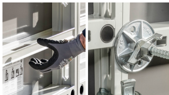
Utilisation simple grâce aux poignées intégrées, et grand nombre de réemplois grâce au panneau Xlife à la bague de protection pour ancrage