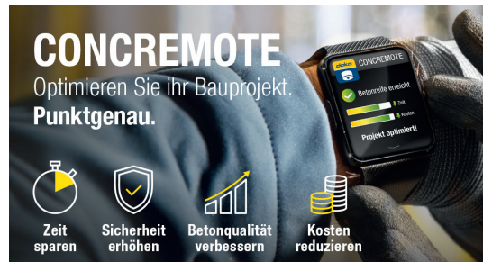
Concremote von Doka