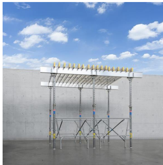
Système applicable avec notre système Flex, poutrelles Alu Tec-2.