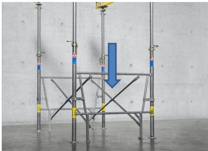
Grande adaptabilité sur site grâce aux différentes longueurs de croisillon de 1,5 m à 3 m.