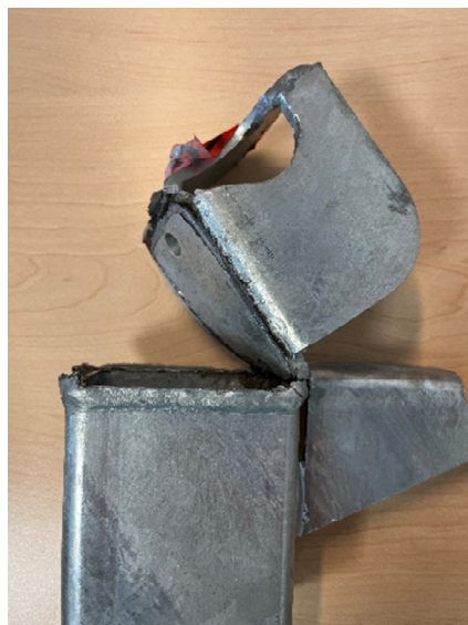
obr. č. 3 Odlomený svar