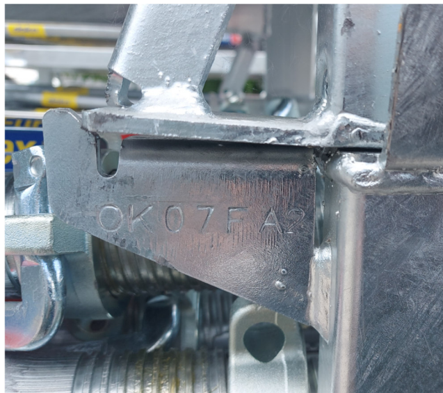
obr. č. 4 Označení - vyražený kód na stohovací paletě