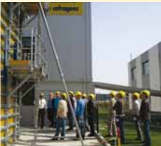
Formações Doka 2009.