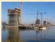
Ponte da Lezíria

Mesas Dokaflex: Satisfação comprovada ..... 4