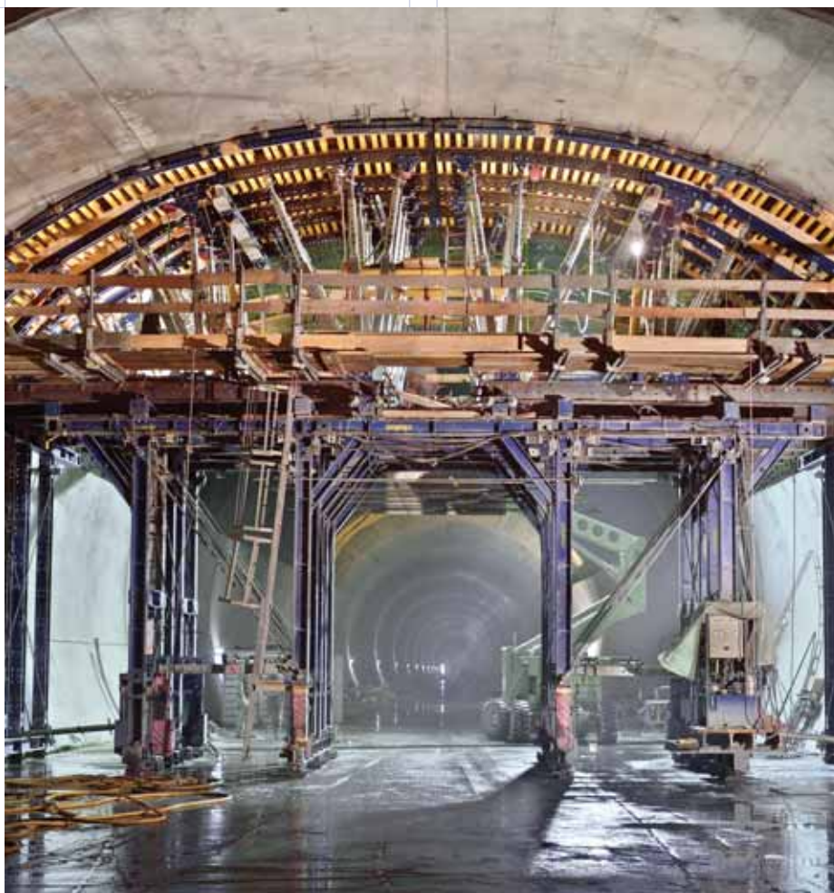
▲ Sistema SL-1 para túneis.

Este know-how está patente nas soluções mais exigentes, como é o caso da cofragem para túneis, composta por dois sistemas base – Cofragem Top 50 e Cimbra SL-1. Esta solução é perfeitamente adaptável a qualquer geometria de galeria, e dá resposta aos vários projectos em análise para as novas concessões, por exemplo Túnel do Marão, ou para o projecto do TGV.