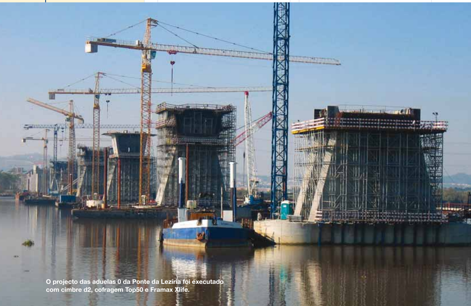
O projecto das aduelas 0 da Ponte da Lezíria foi executado com cimbre d2, cofragem Top50 e Framax Xlife.