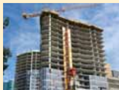
Tv Towers, Canadá

A Doka no mundo: TV Towers no Canadá e viaduto único na Bavária ..... 11