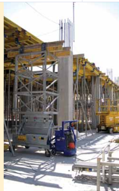
▲ Translação rápida das mesas.

Cumprimos os prazos previstos e garantimos uma boa qualidade do produto final bem como a satisfação do nosso cliente. Por outro lado, permitiu à FCM ser mais uma vez pioneira na utilização de determinado sistema de cofragem em Portugal. □