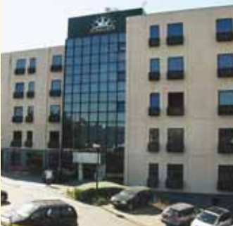
Novas instalações na Maia.