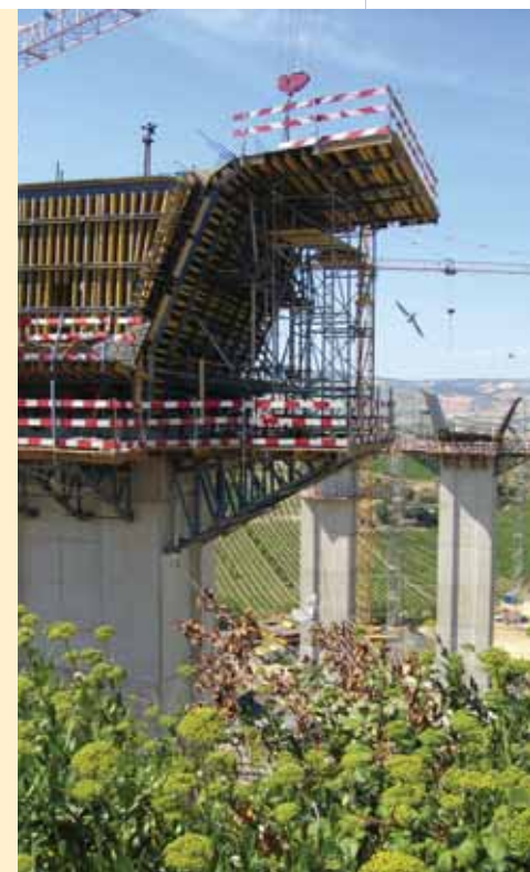
▲ Viaduto sobre a Ribeira da Pipa- A10.

Por último, o sistema de cofragem Doka para tabuleiros misto que está actualmente a executar o tabuleiro do Atravessamento Ferroviário do Sado, é um sistema bastante versátil que se adapta a todas as secções de tabuleiro e que se posiciona num método construtivo com cada vez mais procura. □