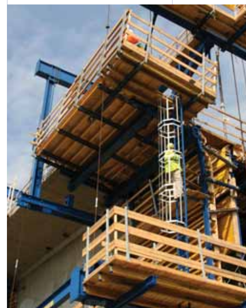
▲ Segurança garantida a todos os níveis.

uma estrutura flexível, permite a sua utilização em segmentos de tabuleiro rectos, inclinados e com diversas formas de caixão simples ou variados, sem grandes ajustes que consomem bastante tempo e dinheiro. O Centro de pesquisa Doka analisou detalhadamente a possibilidade de aperfeiçoar os já existentes carros de avanço, e transformou esses resultados em realidade desenvolvendo o novo sistema de carros de avanço para satisfazer as necessidades exigidas em obra.