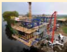
Carros de Avanço

Mesas Dokaflex: Satisfação comprovada ..... 4