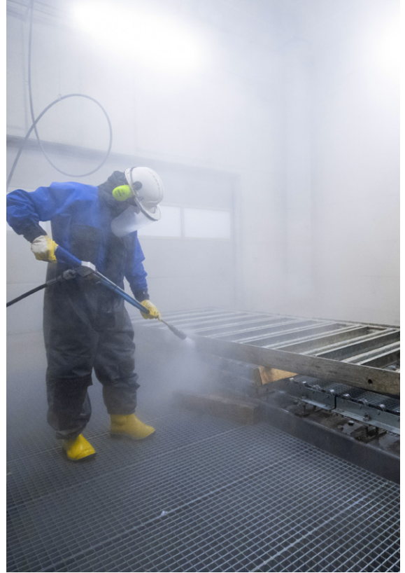
Le nettoyage professionnel est effectué dans une installation de lavage et de nettoyage ultramoderne.

Outre la compensation de ces prestations en fonction du travail réalisé, nous vous proposons trois différents forfaits de services pour les systèmes suivants: Framax Xlife plus, Framax Xlife, Frami Xlife, DokaXlight, Dokadek 30 et DokaXdek.