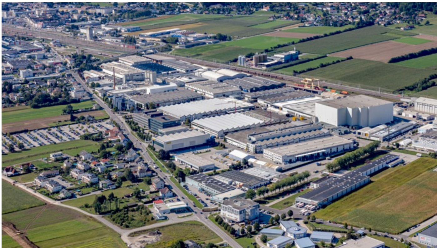
Centrála Doka-skupiny v Amstettene | Rakúsko